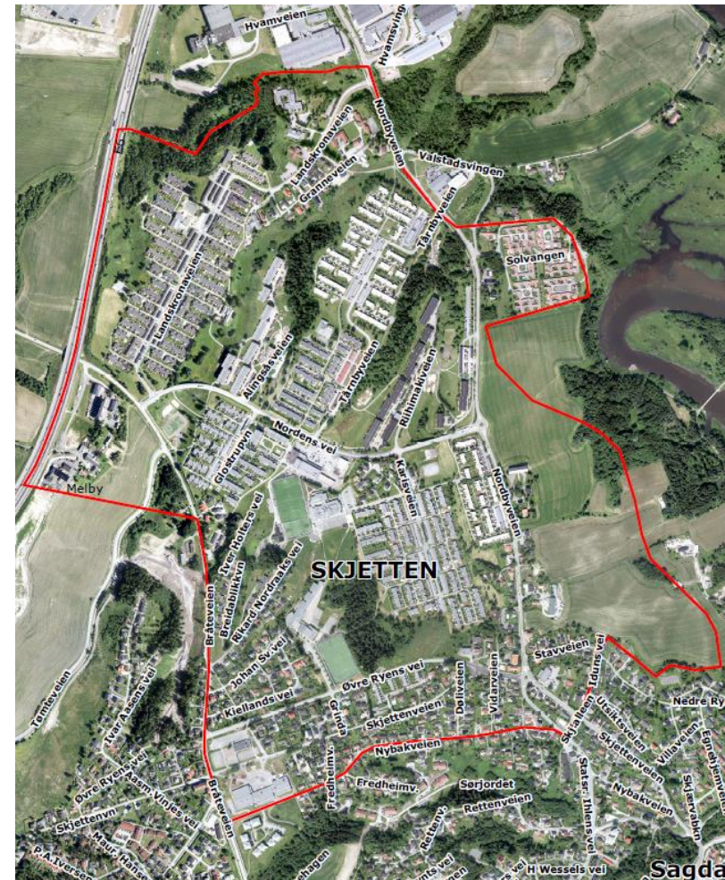
Figur 1 Avgrensning for områdesatsingen i Skjetten

Det er også andre områder utenfor denne avgrensningen som både er en del av Skjetten og som er viktige for beboerne på Skjetten, derfor vil ikke en slik avgrensning være helt absolutt.